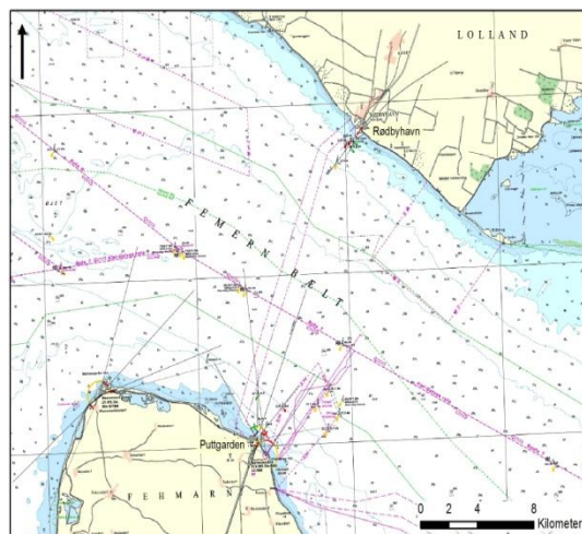
Kuva 2. Fehmarninsalmi, Puttgarden ja Rødbyhavn